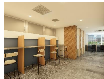
カフェブース イメージ

コロナ禍ではたらく人々に欠かせなくなった WEB 会議。カフェブースは WEB 会議 OK でも「話の内容が周囲に聞こえてしまう点が気になる」という方向けに、遮音性の高いテレフォンブースを用意しています。完全個室のため、安心して WEB 会議ができます。