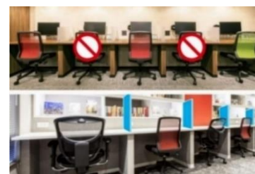
感染症対策 イメージ