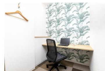
レンタルオフィス イメージ